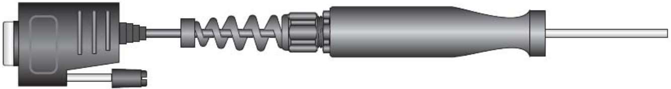
Hand-held temperature probe for 'Control-plus' Hand-held measuring instrument Figure 138 00 003